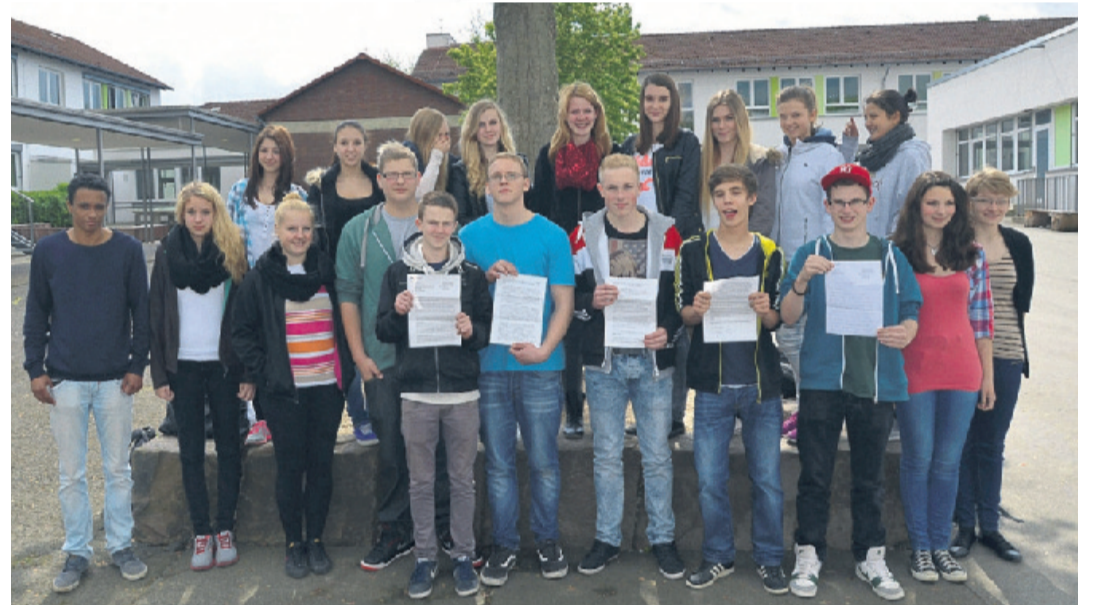
Die Schülerinnen und Schüler der Klasse R10b der Freiherr-vom-Stein-Schule Immenhausen mit dem Antwortschreiben aus dem Verteidigungsministerium.