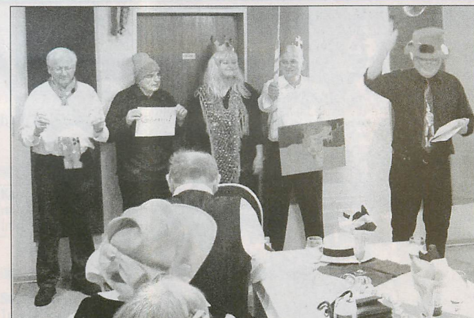
Der Sängerknutsch vom 2. Tenor